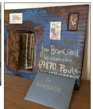
Photos prises par l'enseignante des œuvres postales de Jean BRANCIARD et vidéoprojetées en classe.